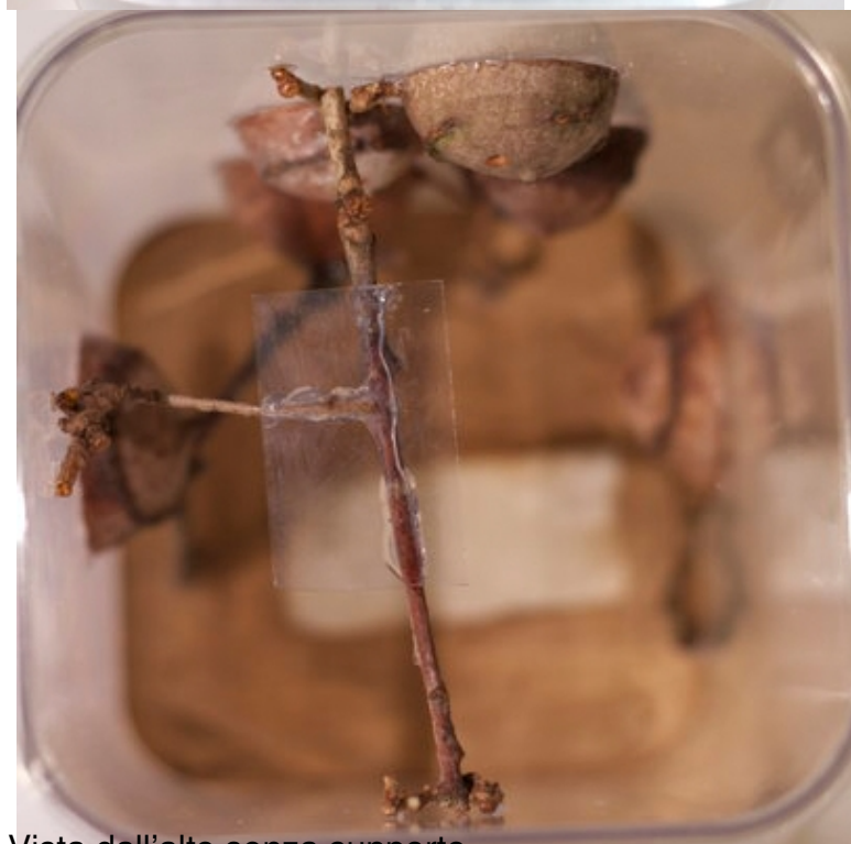
Vista dall'alto senza supporto